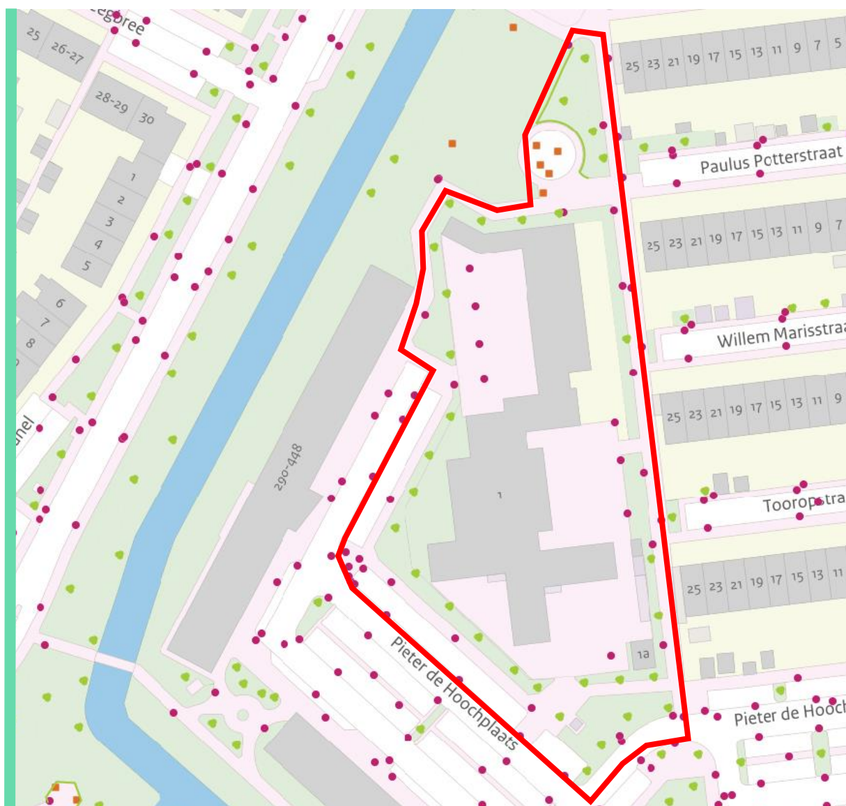
Afbeelding 1: het projectgebied (rood omkadert)

Binnen het projectgebied zijn 31 bomen gecontroleerd. De projectlocatie is weergegeven op de onderstaande tekening (rood omkadert) en in bijlage 1 .